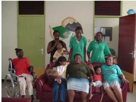
Een aantal van de bewoners en personeelsleden van de 24 uurszorg.

Alle bewoners zijn dit verslagjaar besproken in het multidisciplinair team. De mentor maakt een verslag van het afgelopen jaar en dit wordt besproken met de arts en de pedagoog.