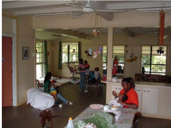
De woonkamer van de dagopvang

De kinderen hebben over het algemeen een zeer ernstige handicap waarbij het zelf omrollen nog niet mogelijk is. Hierdoor ligt de nadruk erg op de verzorging, die dan ook veel tijd nodig heeft.